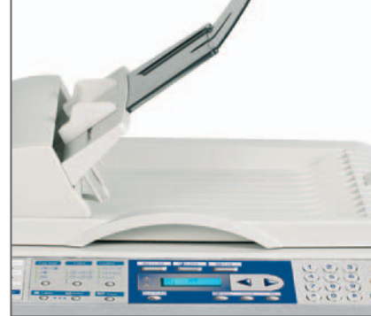
ALIMENTATORE ORIGINALI da 50 fogli di serie