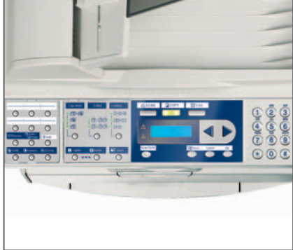
PANNELLO OPERATORE con tasti funzione copia, scansione e fax (d-Copia 164MF)