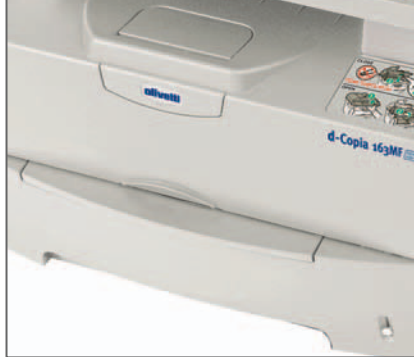
CASSETTO CARTA da 250 fogli e BY-PASS a foglio singolo