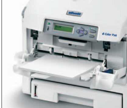
ALIMENTATORE MANUALE per la gestione di svariati supporti carta