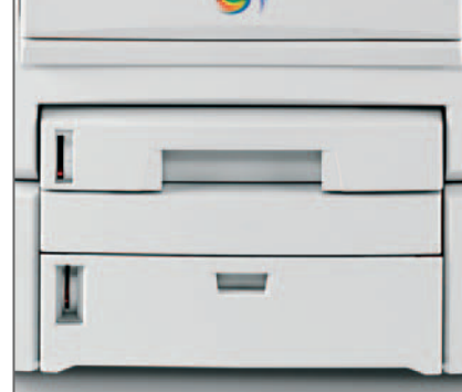
SECONDO CASSETTO OPZIONALE da 530 fogli