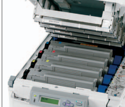
COSTI COPIA b/n e colore tra i più COMPETITIVI del mercato